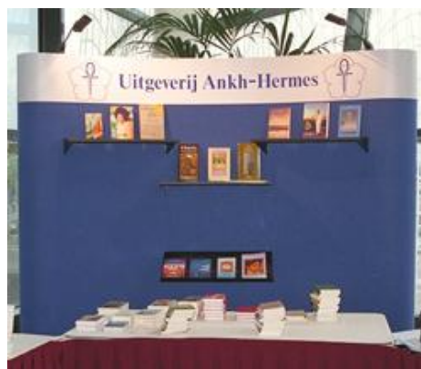
FABRIC presentatiewand voor uitgeverij Ankh-Hermes

Op deze foto van een FABRIC presentatiewand ziet u dat er meerdere leggers kunnen worden geplaatst. Natuurlijk helemaal afhankelijk van uw eigen inzicht, doel en ontwerp van uw presentatie.