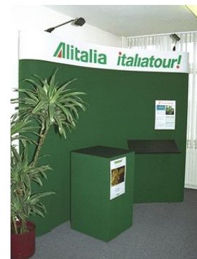
FABRIC presentatiewand voor Alitalia

Ook in het uiterlijk van de FABRIC presentatiewanden zijn er mogelijkheden. De wanden kunnen zijn uitgevoerd met gebogen en rechte frames. Ook een variatie is mogelijk. Wanneer de presentatiewand in een open ruimte moet worden opgesteld, kunnen beide zijden van panelen worden voorzien. Waarom niet eens ánders presenteren? Dan stelt u uw wand op met de bolle zijde naar voor en uw heeft een heel andere presentatie.